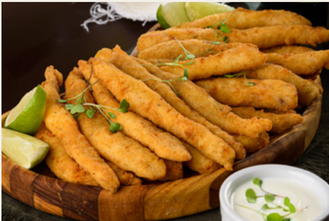
ISCA DE TILÁPIA R$ 79,90

Frango ao catupiry gratinado ao parmesão. Acompanha torradas de pães.