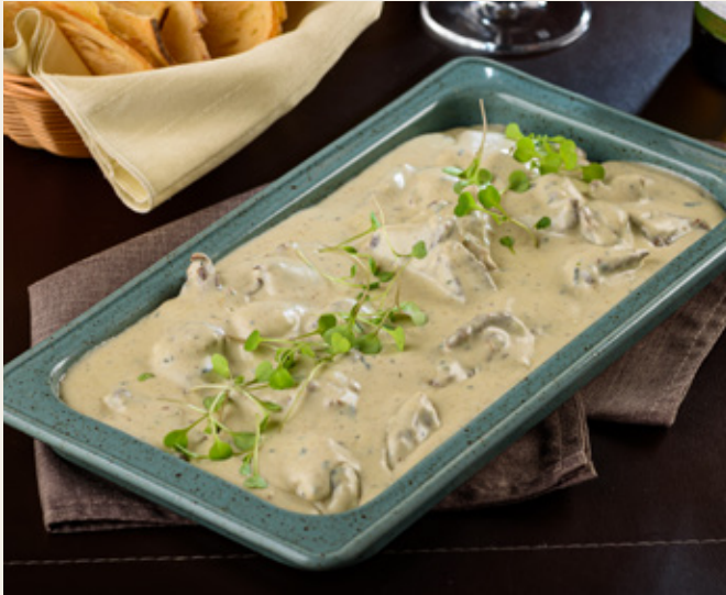
FILE À GORGONZOLA R$ 149,90

Iscas de filé mignon com creme de gorgonzola e chips de pão rústico.