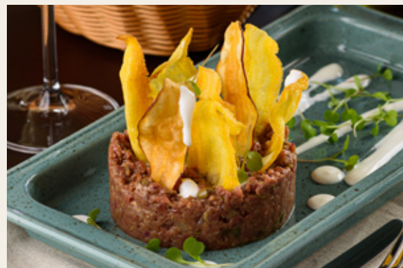
STEAK TARTARE R$ 89,90

Lagarto bovino, rúcula, molho mostarda, xerém de alcaparras e tiras de parmesão.