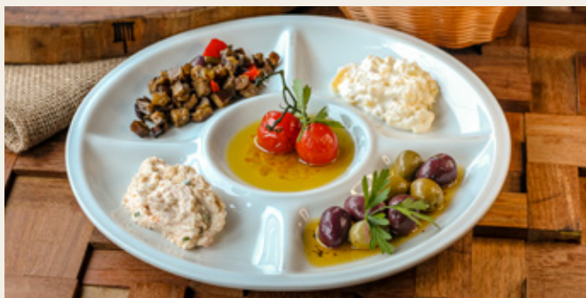
COUVERT R$ 49,90

Burrata ao pesto, tomates cereja, presunto parma e rúcula.