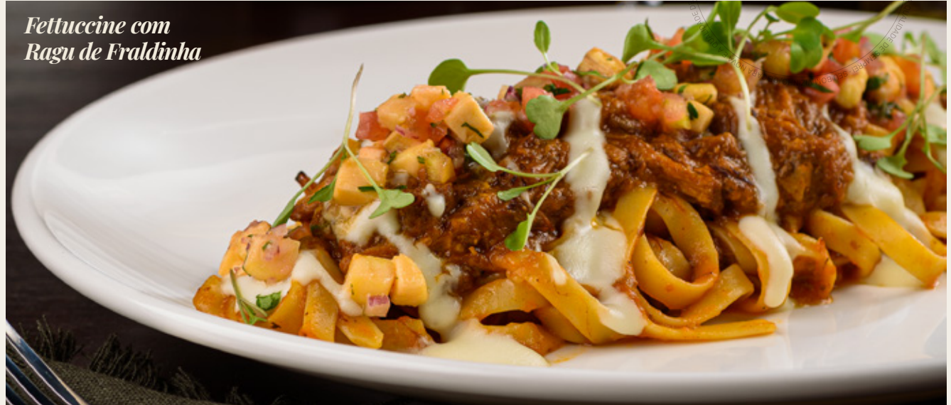
Fettuccine com Ragu de Fraldinha

1 2 3 FETTUCCINE R$ 79,90 149,90 284,90 COM RAGU DE FRALDINHA