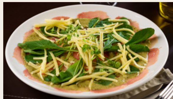
CARPACCIO R$ 59,90

Cubos de salmão marinados com limão siciliano, cebola roxa, coentro e pimenta dedo de moça. Acompanhado de lâminas crocantes de pão rústico.