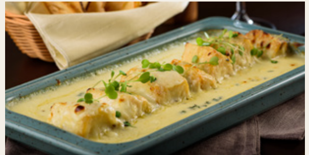
ROBALO GRATINADO R$ 119,90

Iscas de filé mignon grelhadas com roti agridoce e macaxeira frita.