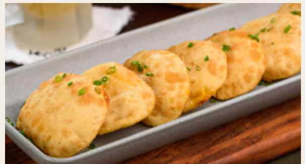
CAMARÃO R$ 54,90 8 unidades.