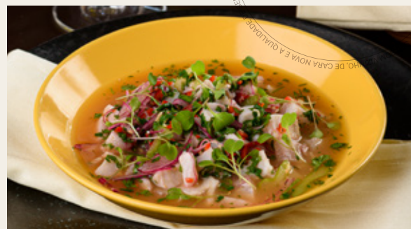
CEVICHE DE TILÁPIA R$ 49,90

Tomate cereja marinado, muçarela de búfala e manjericão. Shitake estufado, fonduta de gorgonzola e azeite trufado. Aspargos verdes, limão siciliano, rúcula e parmesão.