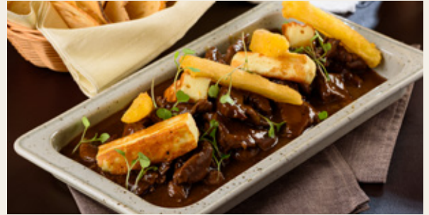
ISCA DE FILÉ À MODA MINEIRA R$ 119,90

Iscas de filé mignon grelhadas com roti agridoce e macaxeira frita.