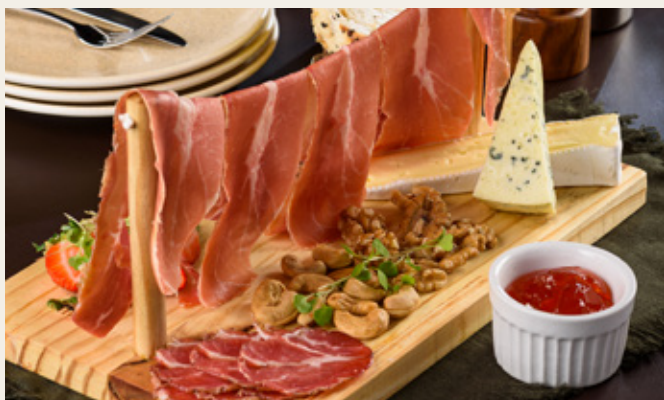
VARAL DE FRIOS R$ 89,90

Presunto de Parma, copa, queijo brie, gorgonzola, geleia de pimenta, morangos, castanhas e pães especiais.